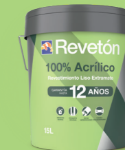
100% ACRÍLICO LISO EXTRAMATE art: 1390