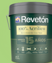
100% ACRÍLICO LISO MATE art: 1426/1384