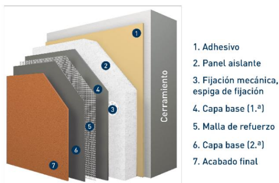
Figura 1. Configuración del sistema SATE estándar

La configuración del sistema SATE es la siguiente: