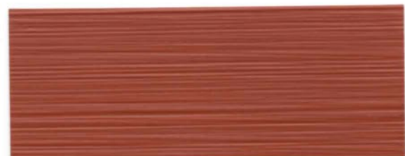
Rojo Teja 017